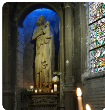
Diocèse de Pontoise

“Réciter le chapelet signifie, en effet, apprendre à regarder Jésus avec les yeux de sa Mère, aimer Jésus avec le cœur de sa Mère.”